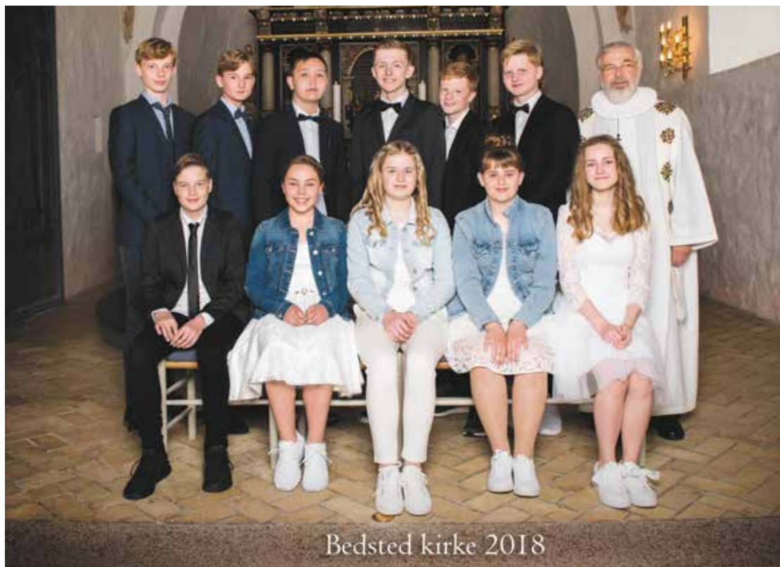
Bedsted kirke 2018