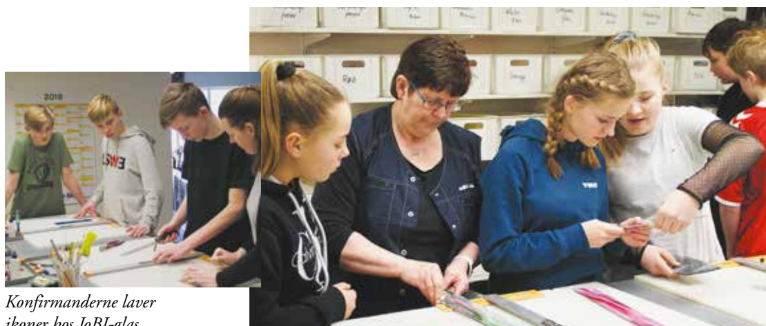
Konfirmanderne laver ikoner hos JoBI-glas