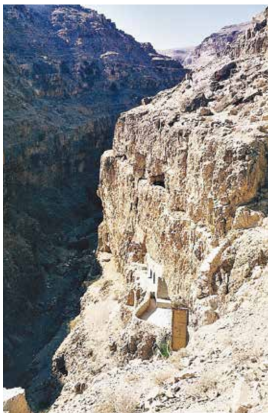
Eneboerhule (med terrasse) i en øde bjergslugt i nærheden af Jeriko (EHB).

Det giver deltagelsen i gudstjenesten ny intensitet. Ordene og de liturgiske udtryk får mening og bliver kanaler for vor egen tro. Det giver åbenhed for salmernes ord og deres tit dybt prøvede mening. Ordene bliver ikke bare ord, men levet virkelighed. Og i det alt sammen, at Gud taler til os, at lovsang bliver vor lovsang og bønnen vor bøn. At vi hører Gud, når han taler til os i åbenbaringsordet. Og på den måde kommer det til at løfte vort daglige liv og de mange ting, vi står midt i. Og det holder os fast. Det holder os fast i, at Gud er nær i det alt sammen. For han går med os, og hans ord giver os nye åbninger i forhold til mennesker omkring os. For Gud kalder os ikke ud af verden, men ind i verden. Det er der, troen åbner livet.