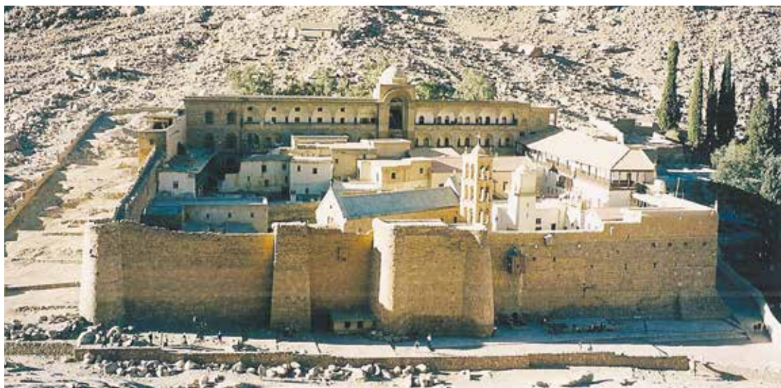
Skt. Katharina klosteret nedenfor Sinai bjerg fra det 4. århundrede. Et af verdens ældste endnu fungerende klostre (EHB).

Det er det, vi skal fastholde og finde dybere ind i ved at finde tid og have ro omkring os til at læse om det, til at bede og fordybe os.